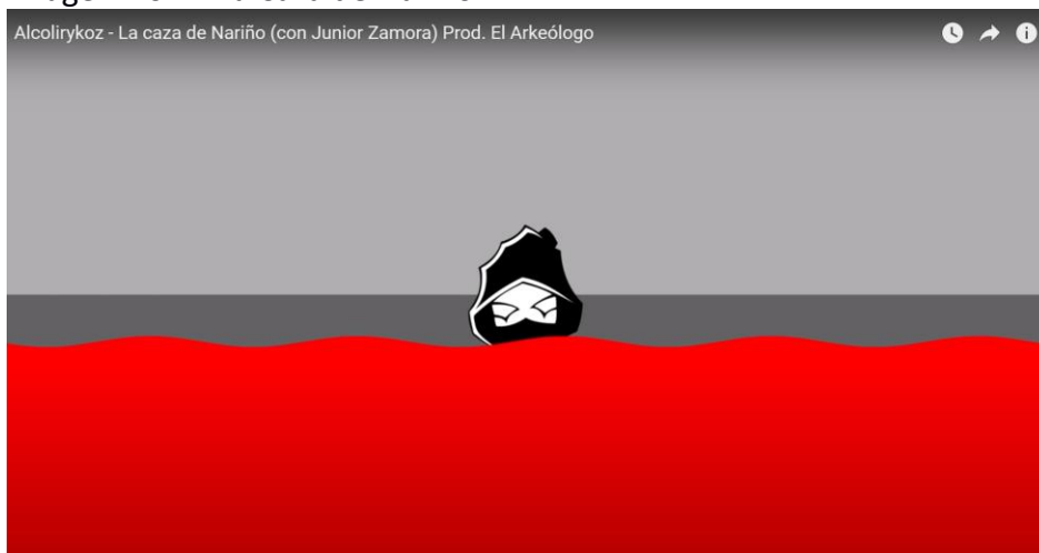
Imagen No. 7. La Caza de Nariño

El símbolo característico de la banda se va ahogando en sangre.