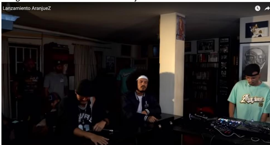
Imagen No. 6. Lanzamiento de Aranjuez

Conexión en línea con las audiencias durante el lanzamiento del álbum.