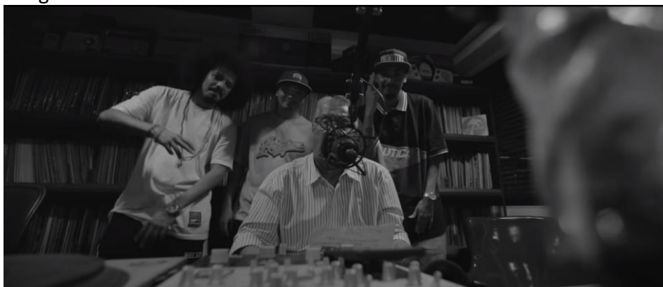
Imagen No. 1. Piñata en el 301

El video empieza con la locución de Jairo Luis García, el locutor más popular de la principal emisora salsera de la ciudad, atrás aparecerán los Alcolirykoz.