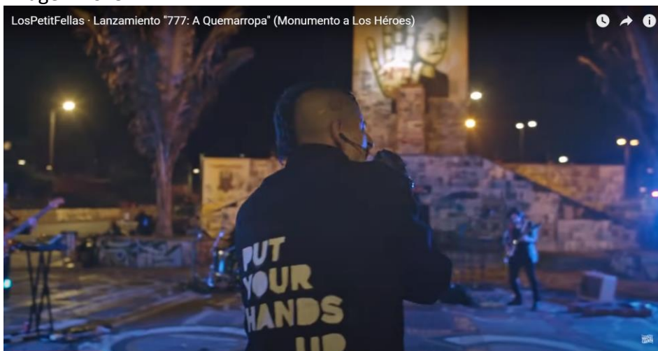
Imagen No. 5

Los mensajes de las ropas de los músicos se integran con el nuevo monumento a Los Héroes.