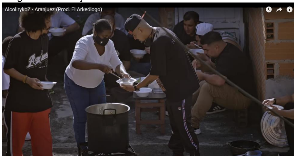
Imagen No. 2. Aranjuez

El sancocho en leña es uno de los escenarios más populares de socialización.